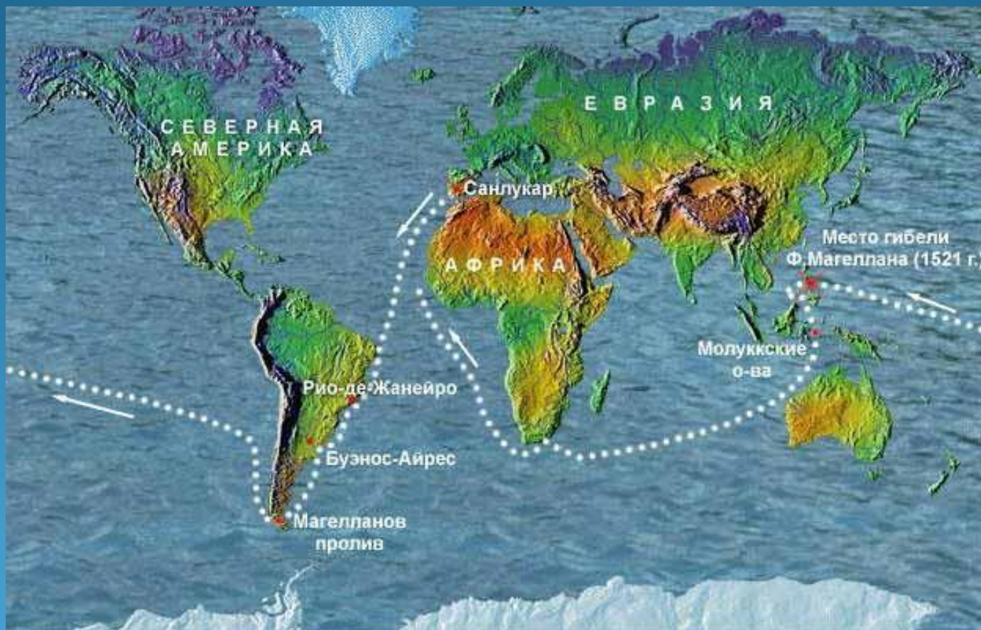
Первая кругосветная экспедиция Ф. Магеллана. 1519-1522 гг.