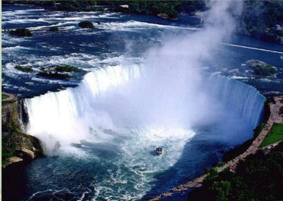
Ниагарский водопад в Северной Америке.