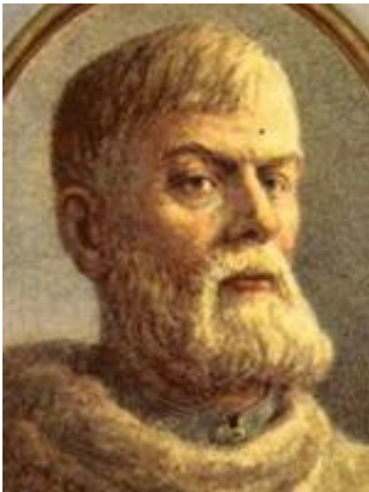
Дежнёв Семён Иванович