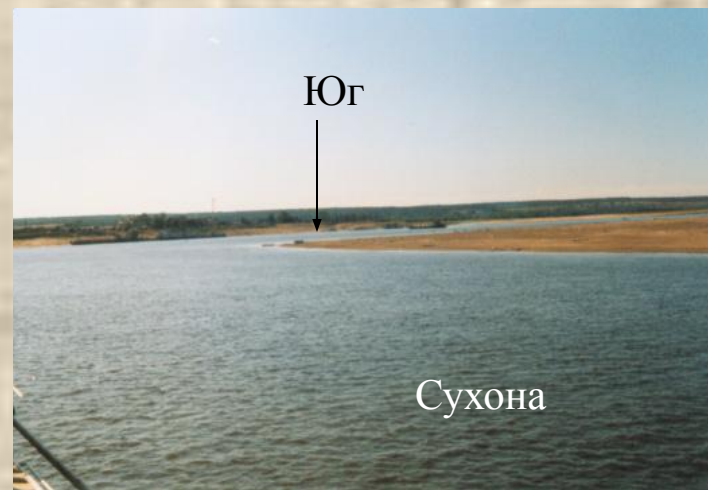
Место слияния Сухоны и Юга