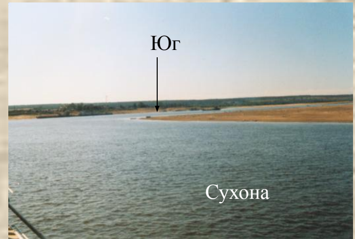
Место слияния Сухоны и Юга