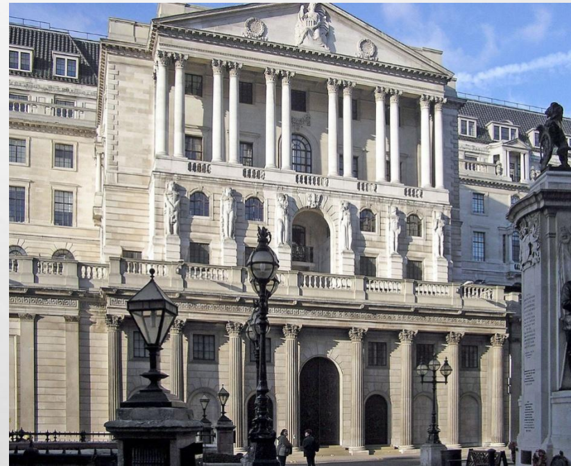
Банк Англии, центральный банк Великобритании.