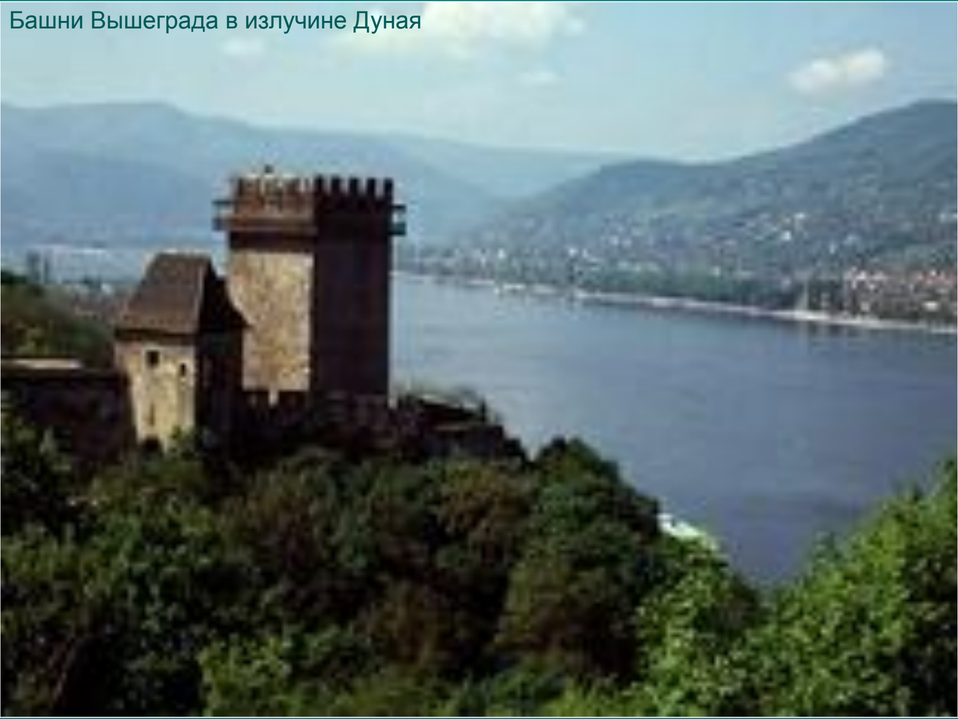
Башни Вышеграда в излучине Дуная