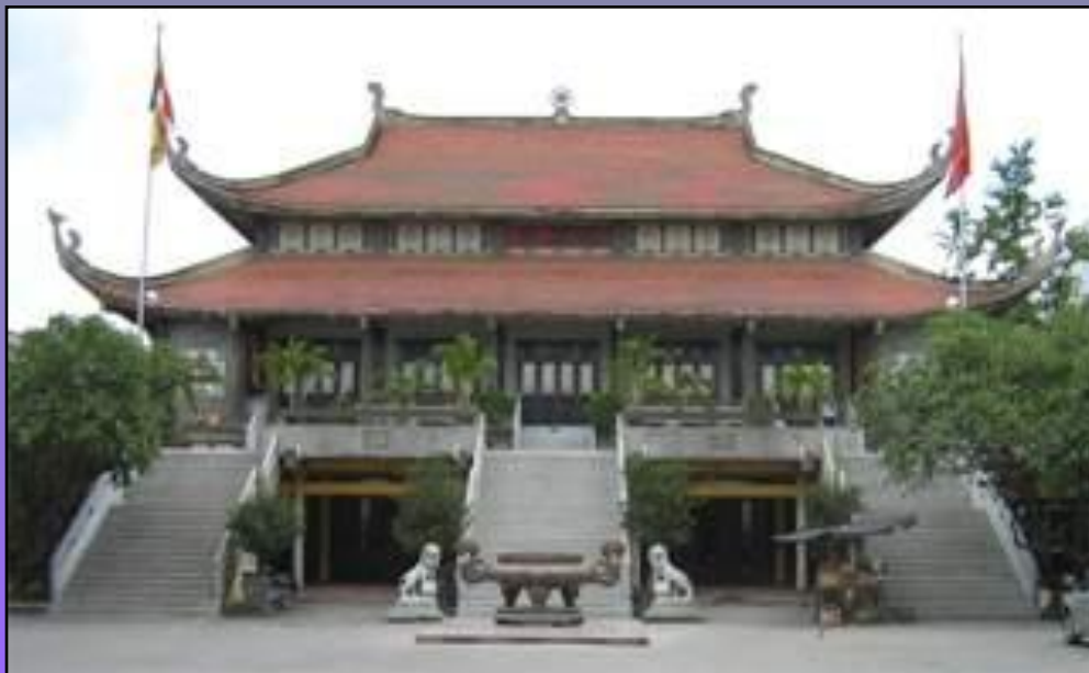
Действующая буддийская пагода в г.Хошимине