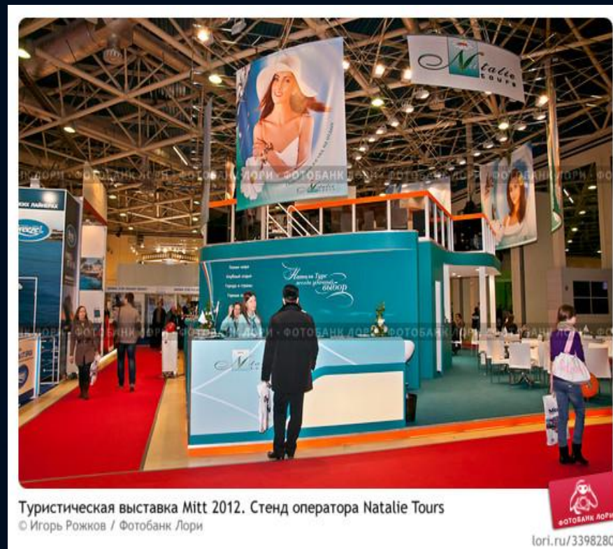
Туристическая выставка Mitt 2012. Стенд оператора Natalie Tours