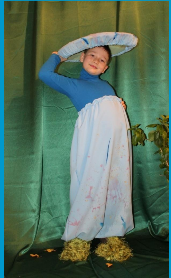
Гриб Гирупор синеющий

По тропинке Гирупора Теллермановского бора Отправляемся, друзья. Гидом вашим буду я.