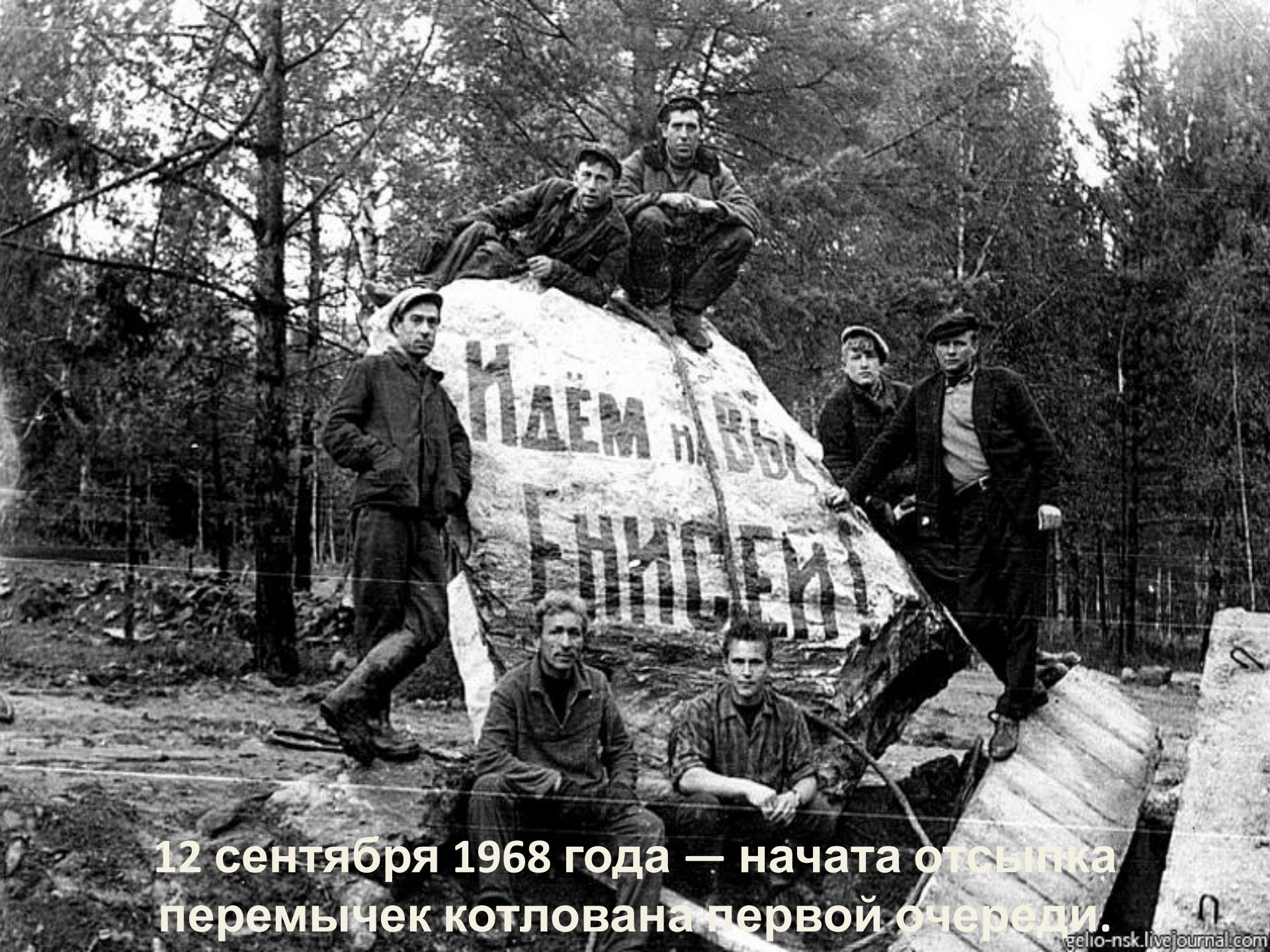
12 сентября 1968 года — начата отсыпка перемычек котлована первой очереди.