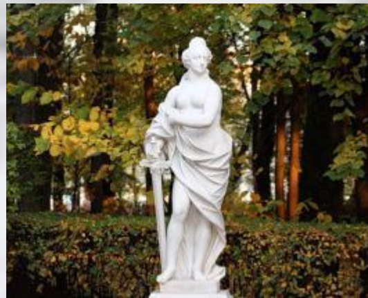
АЛЛЕГОР ИЯ ИСТИНЫ