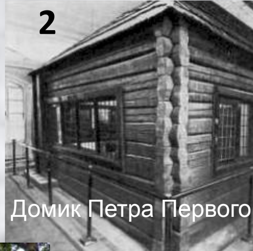
Домик Петра Первого