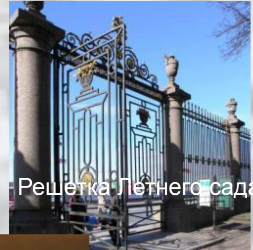
Решетка Летнего сада