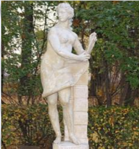
АЛЛЕГОРИЯ АРХИТЕКТУ РЫ