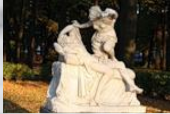
АМУР И ПСИХЕЯ