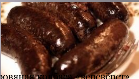
Кровяная колбаса «веревёрст»