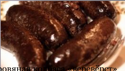
Кровяная колбаса «веревёрст»