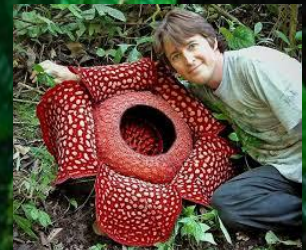
Цветок Раффлезия Арнольда