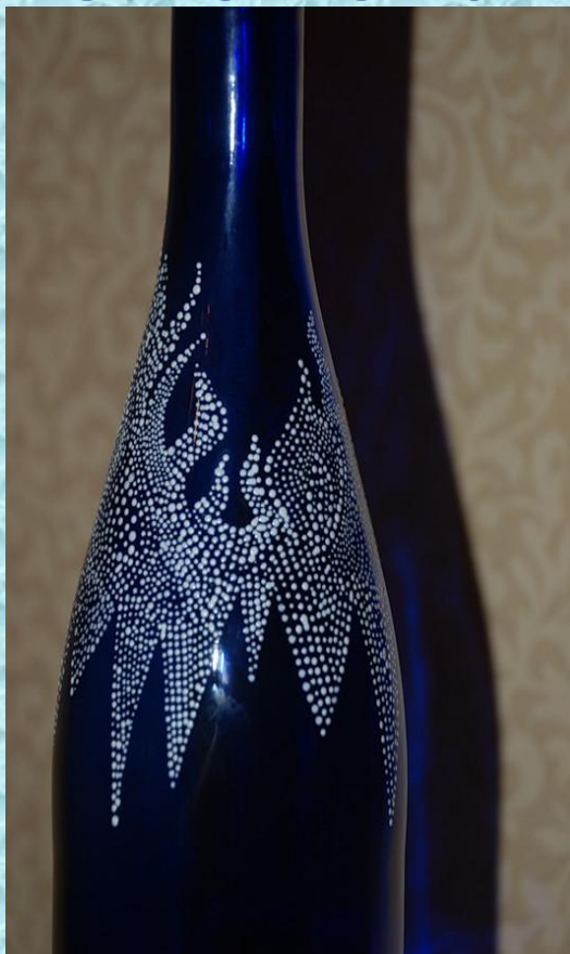
Узоры на различных изделиях