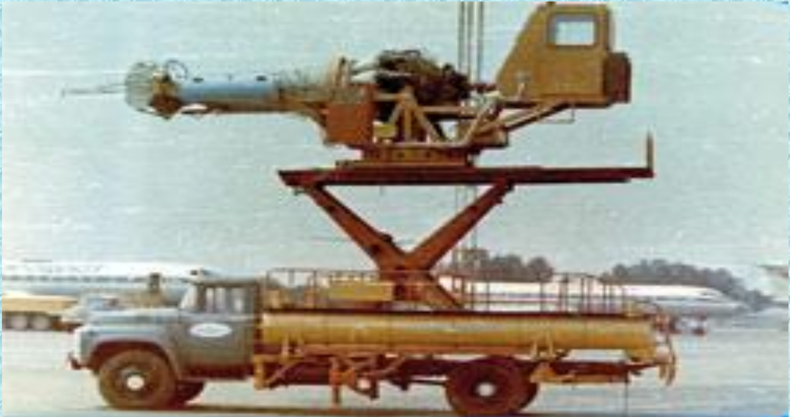
Тепловая газоструйная установка