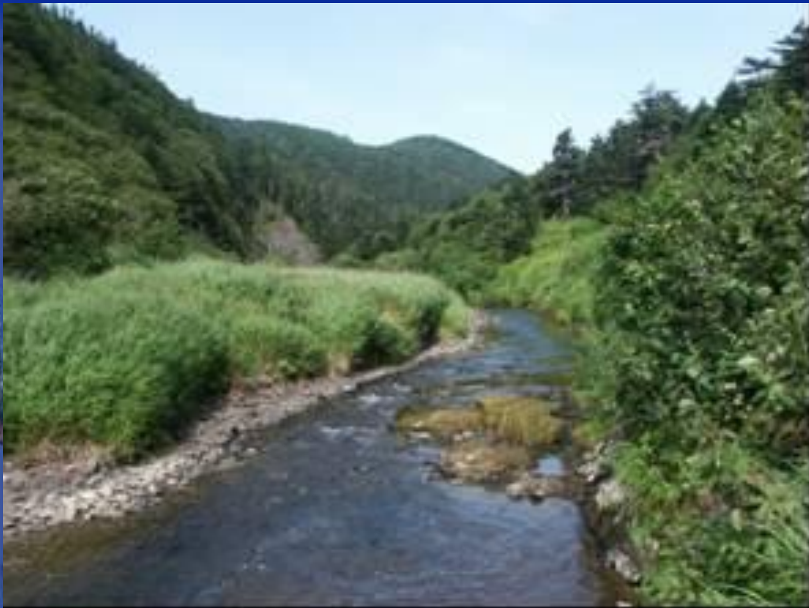
Характерный вид горной реки. Река Учир