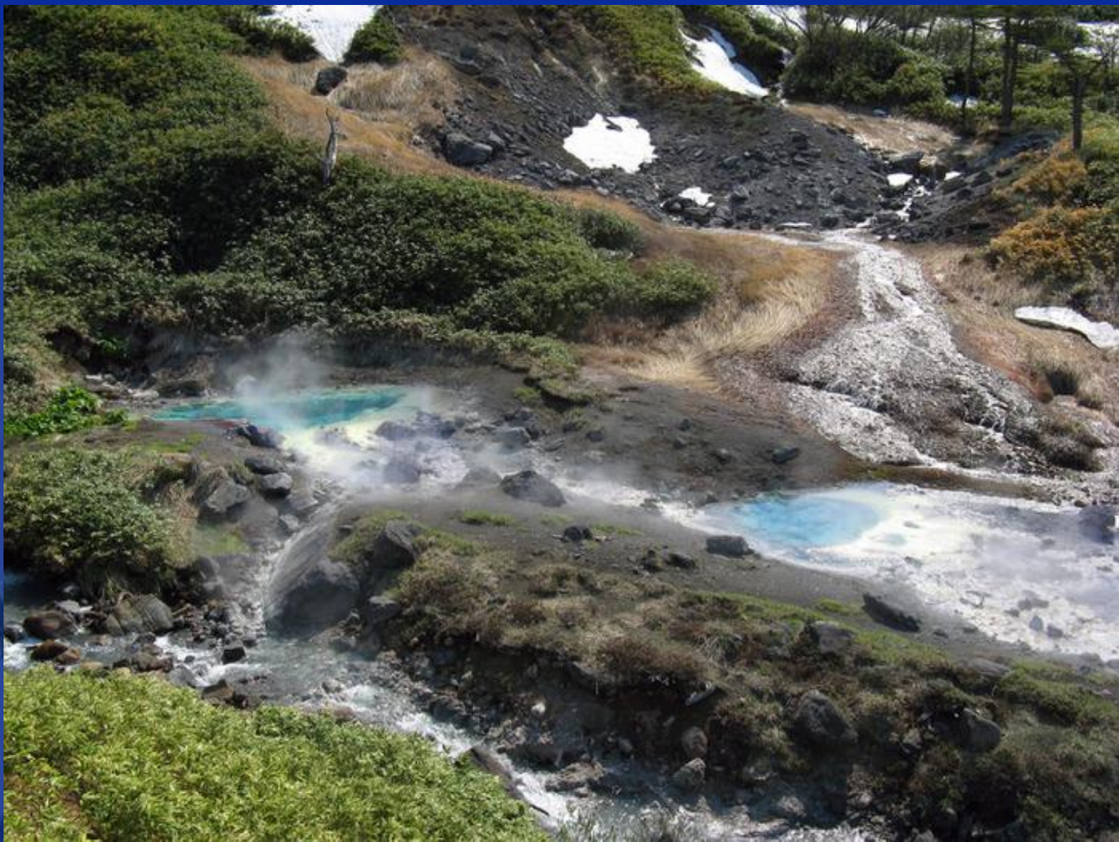
Кипящие озера "Голубые глазки"