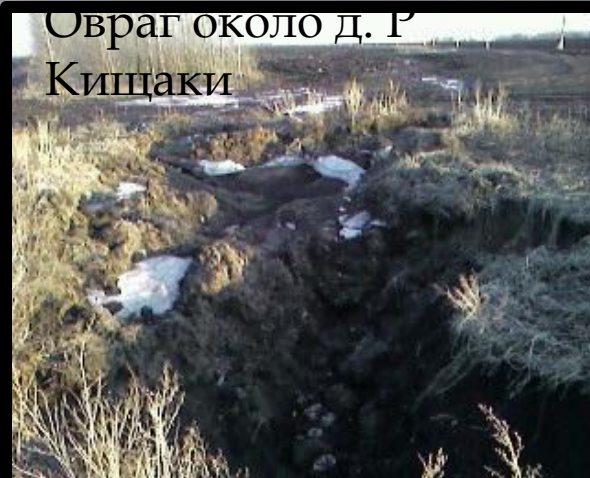
Овраг около д. Р Кищаки