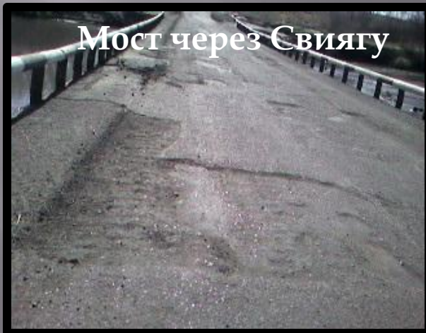
Эрозия на асфальте