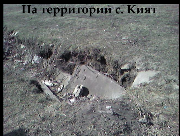
На территории с. Кият