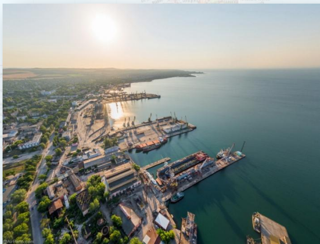
К е р ч