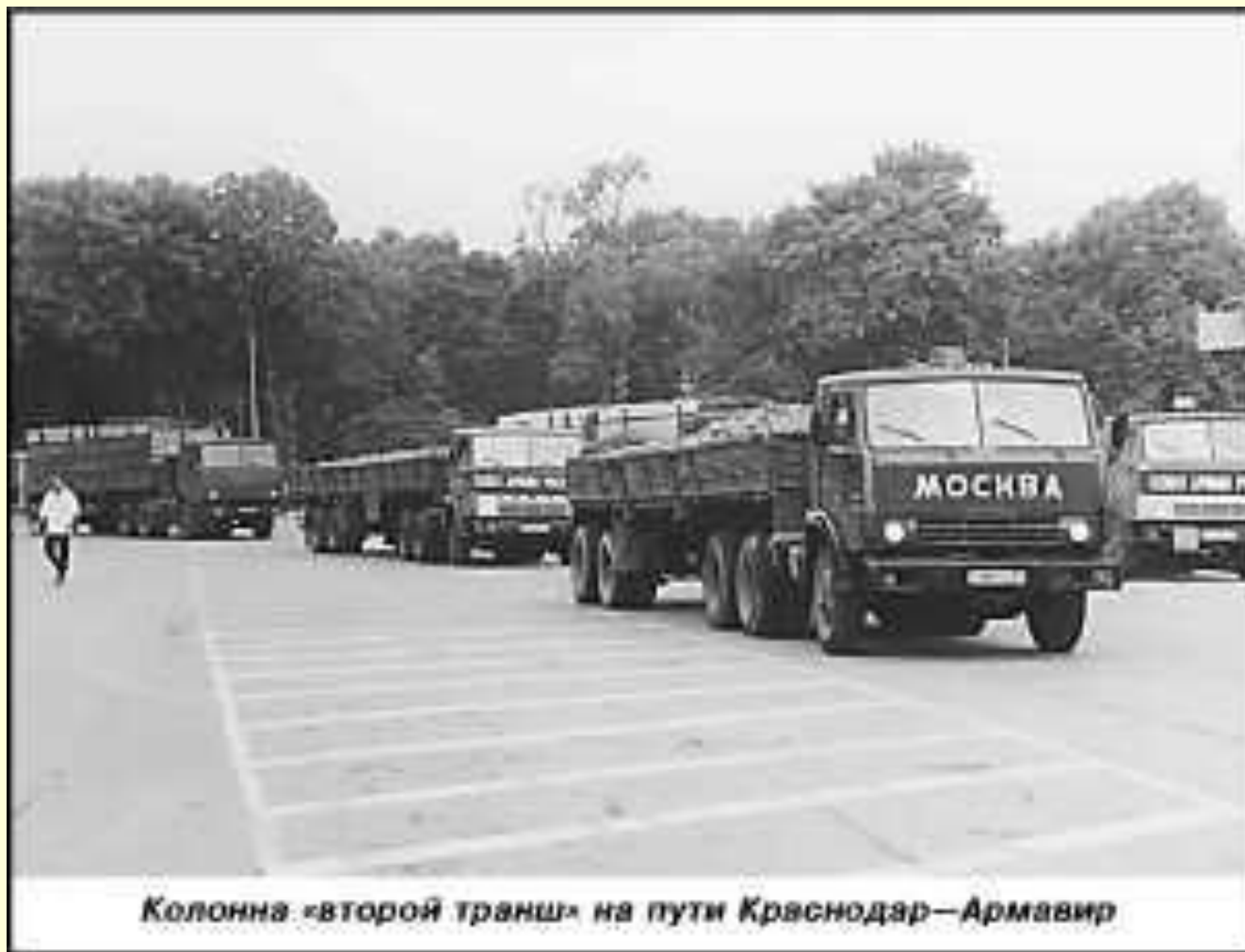
Колонна «второй транш» на пути Краснодар—Армавир

Колонны машин с гуманитарной помощью и строительными материалами шли в Армавир через всю страну.