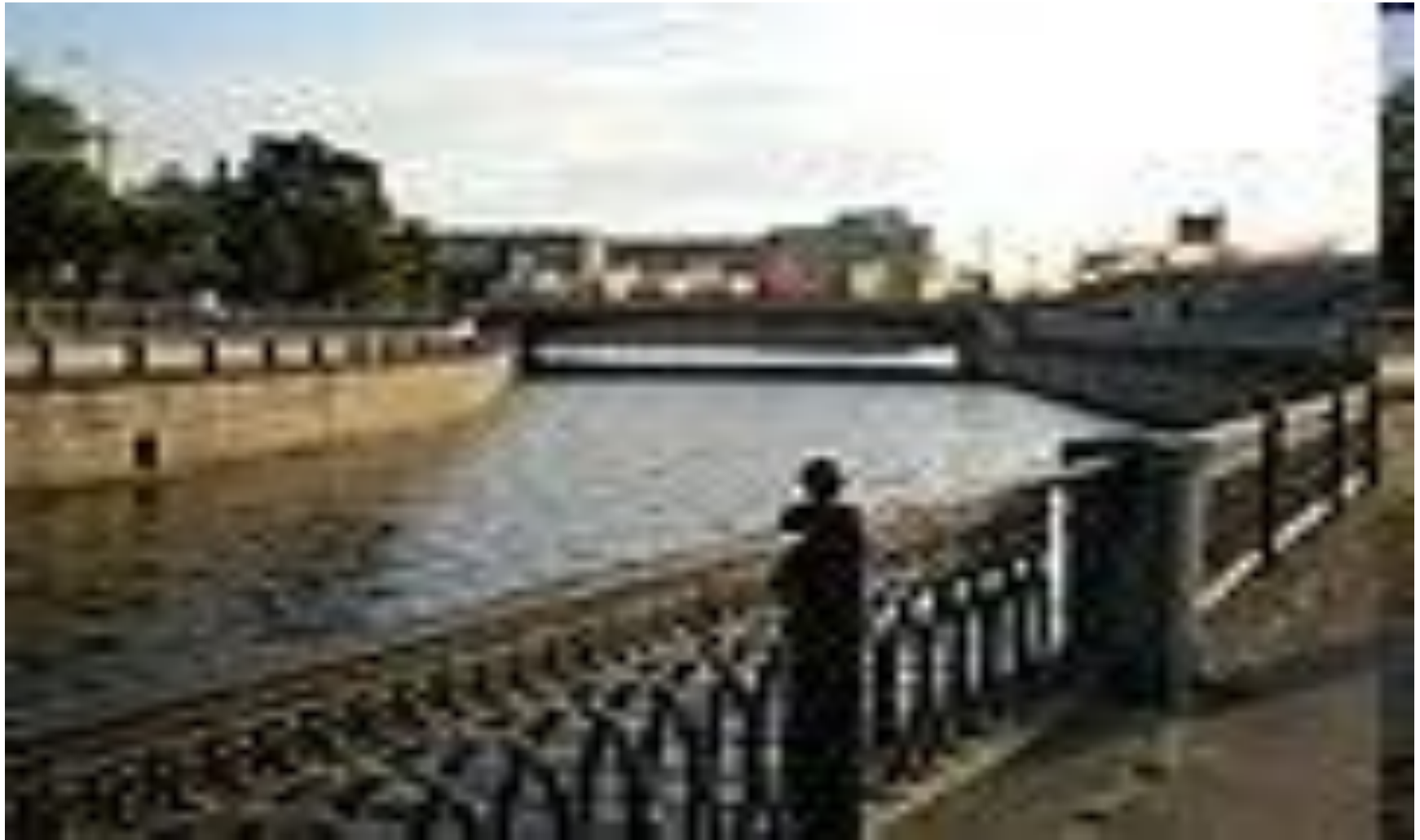
Устье реки Яузы в районе Котельнической набережной