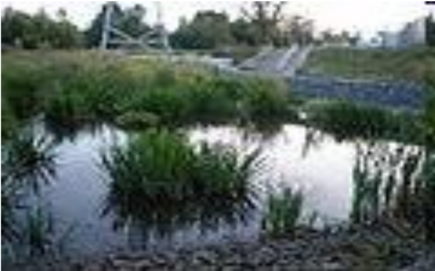
Исток реки Яузы в Мытищах, Ярославское шоссе