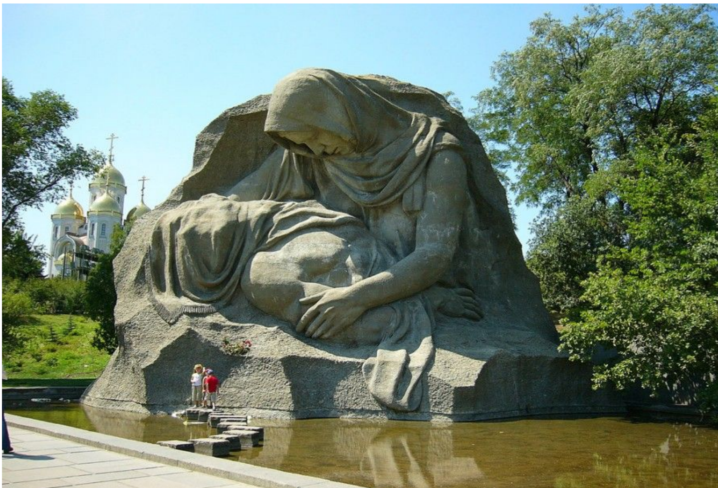
Скульптура «Скорбь матери»