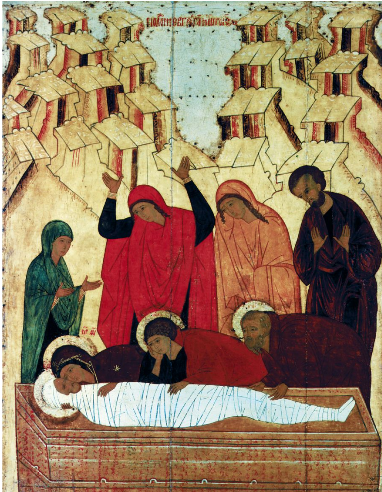
Икона входила в состав праздничного чина из Городца.