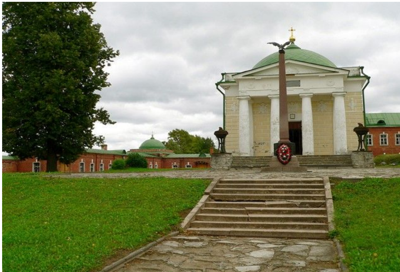
Храм-усыпальница Александра Тучкова