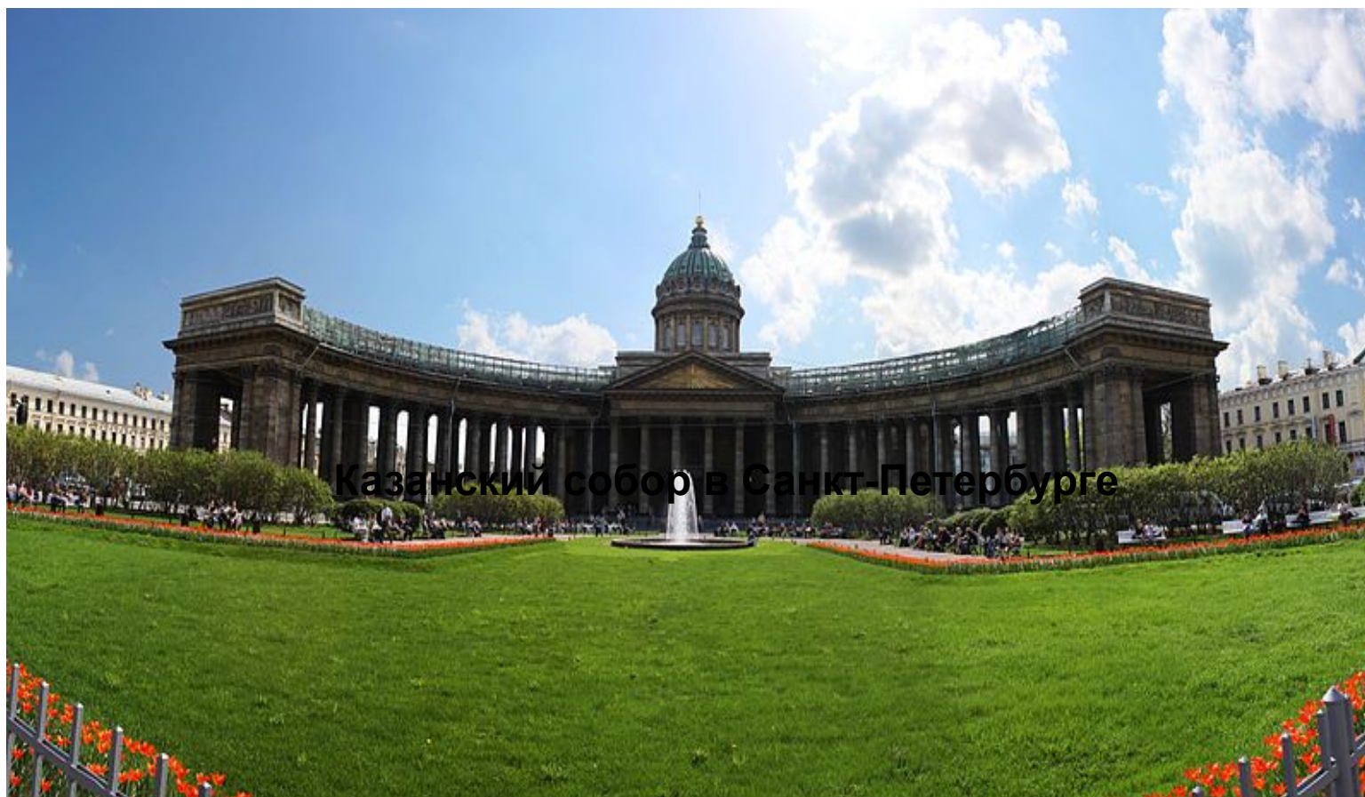
Казанский собор в Санкт-Петербурге