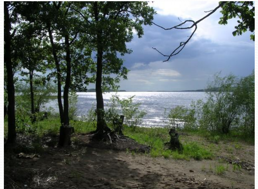
Рыболовные дневники — FION.RU

Волга — типично равнинная река. От истока до устья она спускается всего на 256 метров. Это очень малый уклон по сравнению с другими величайшими реками мира, что дает очень большие удобства для судоходства. Волга 16-я по длине река в мире и 5-я — в России. Словно гигантское дерево раскинула Волга по великой Русской равнине свои ветви — притоки. Почти 1,5 млн. км2 захватила она в черту своего бассейна. Зародившись небольшим ручьем среди лесов и болот возле деревни Волговерховье в центре Валдайской возвышенности, Волга на пути к морю принимает дань от многочисленных притоков (самые крупные из них Ока и Кама) и превращается в могучую реку, самую большую во всей Европе, протяженностью 3700 км, неся свои воды во внутреннее Каспийское море-озеро. В нижнем течении (после Волгограда) у неё нет притоков.