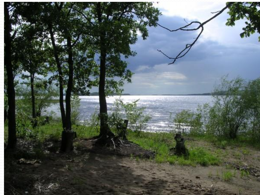
Рыболовные дневники — FION.RU

Волга — типично равнинная река. От истока до устья она спускается всего на 256 метров. Это очень малый уклон по сравнению с другими величайшими реками мира, что дает очень большие удобства для судоходства. Волга 16-я по длине река в мире и 5-я — в России. Словно гигантское дерево раскинула Волга по великой Русской равнине свои ветви — притоки. Почти 1,5 млн. км2 захватила она в черту своего бассейна. Зародившись небольшим ручьем среди лесов и болот возле деревни Волговерховье в центре Валдайской возвышенности, Волга на пути к морю принимает дань от многочисленных притоков (самые крупные из них Ока и Кама) и превращается в могучую реку, самую большую во всей Европе, протяженностью 3700 км, неся свои воды во внутреннее Каспийское море-озеро. В нижнем течении (после Волгограда) у неё нет притоков.