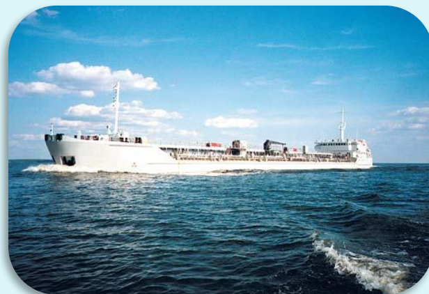
Судно типа река-море