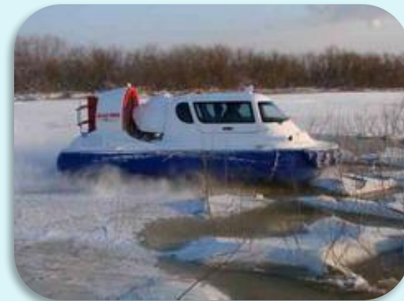
Судно на подушке