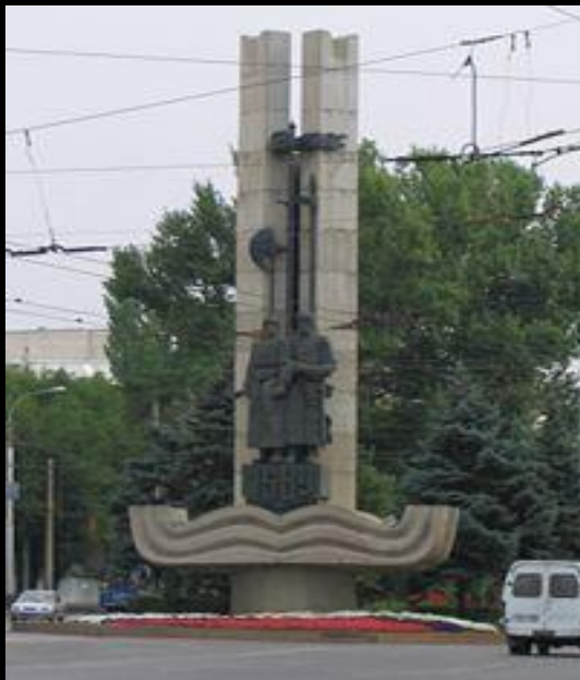
Памятник в честь основания Царицына на пересечении проспекта Ленина и ул. Краснознаменной