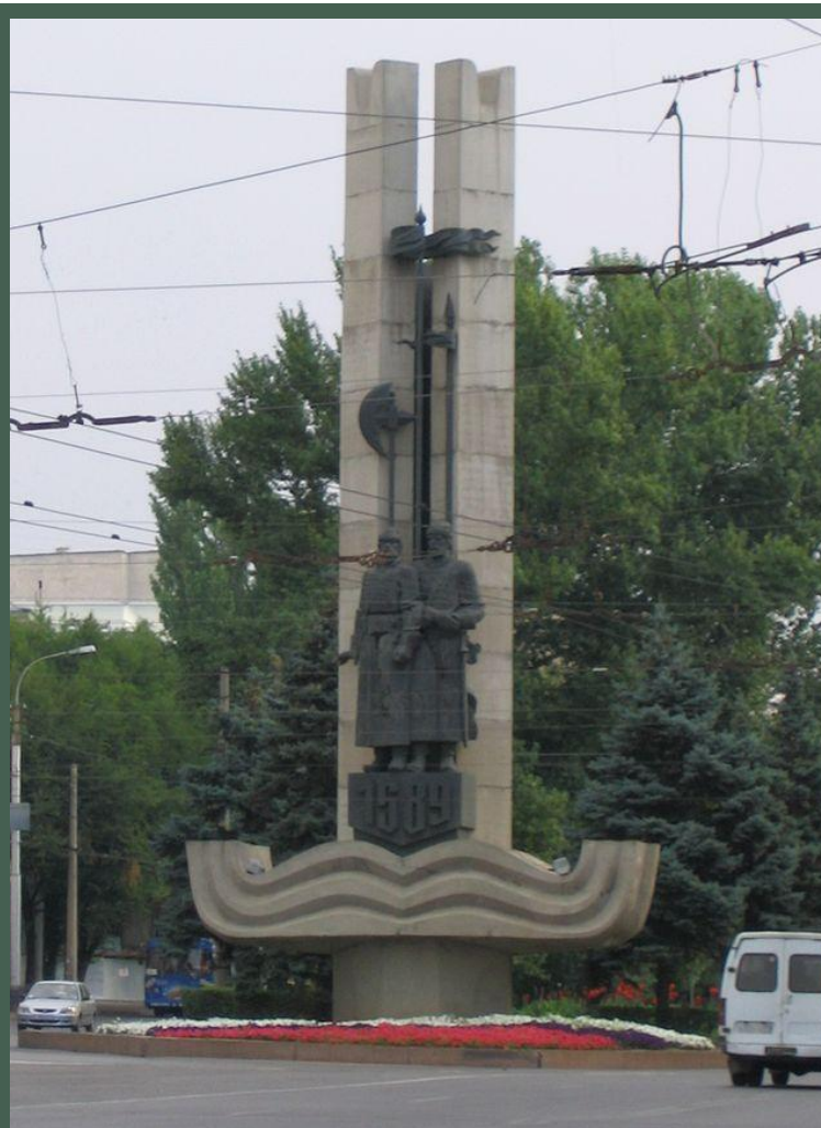
Памятник основанию города