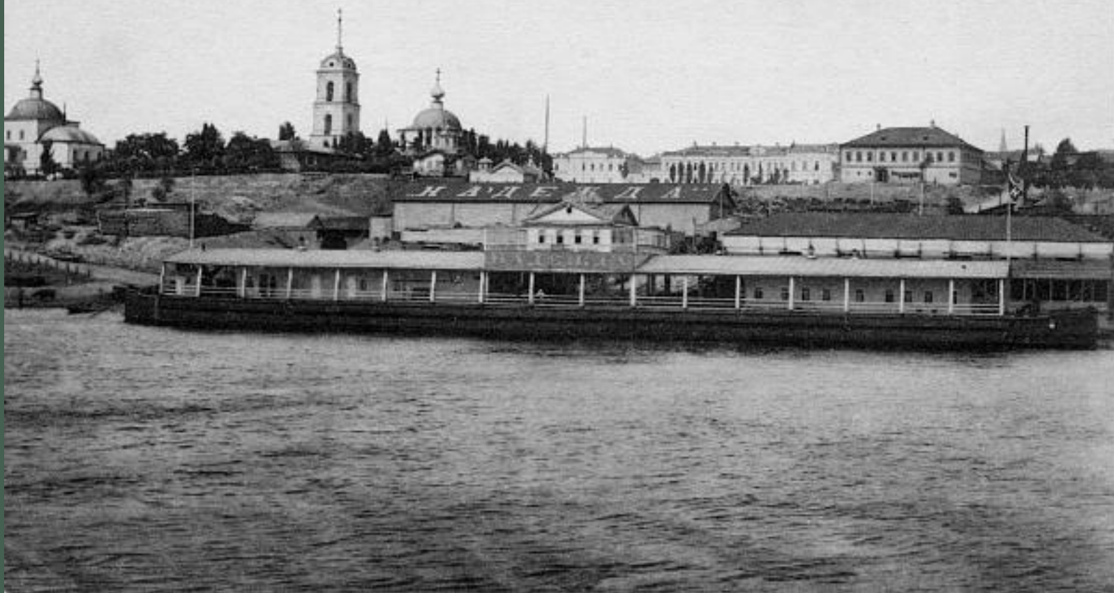
Царицын со стороны Волги