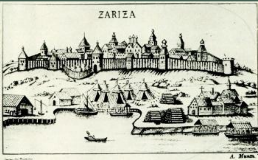
Царицын первой половины XVII века