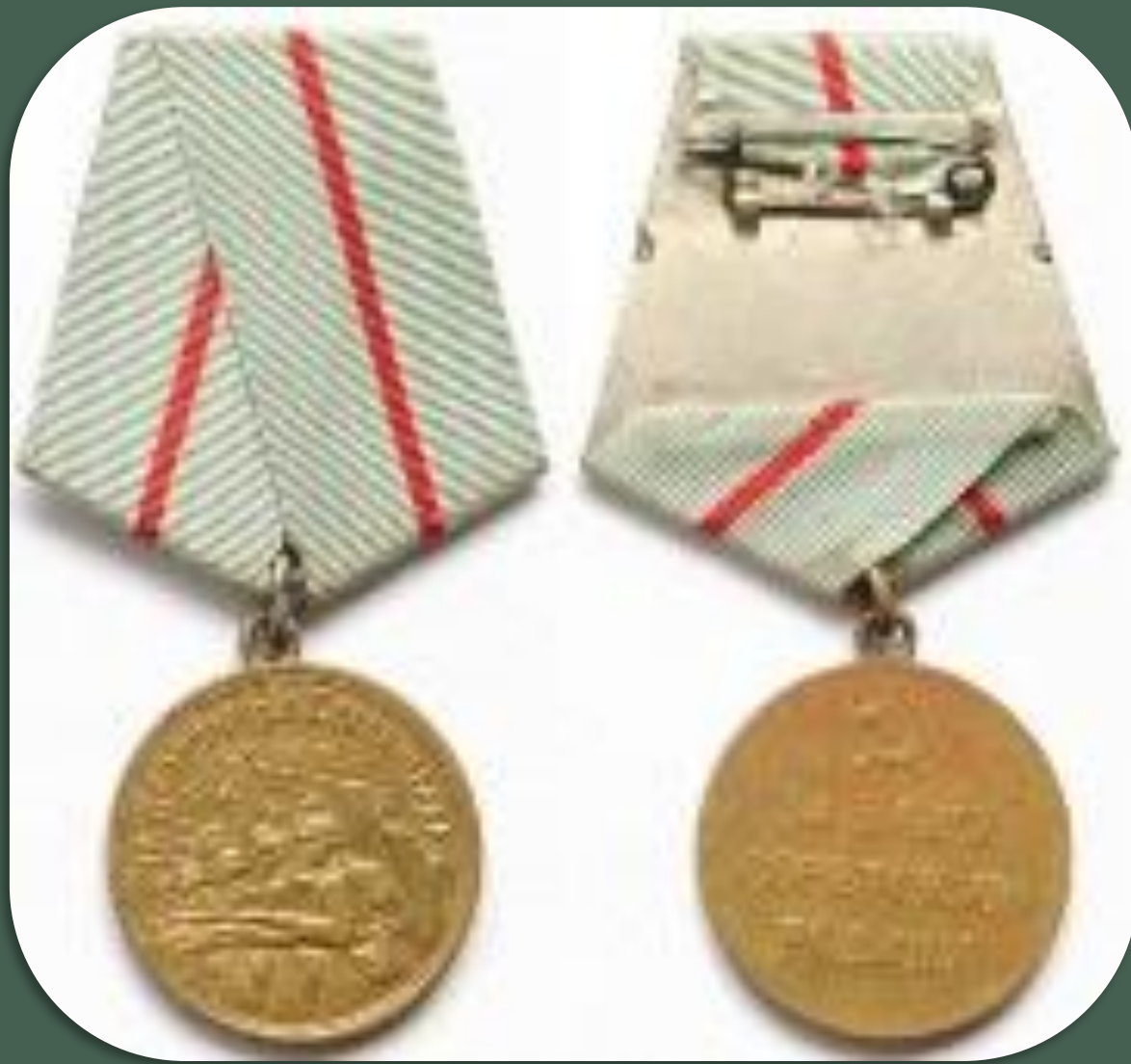
Медаль «За оборону Сталинграда»