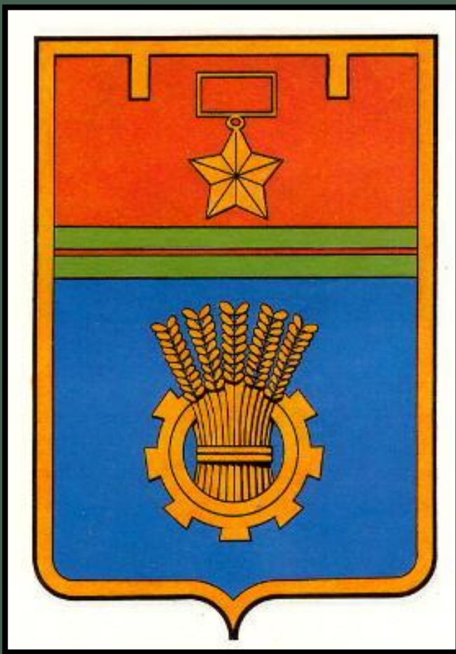
Герб Сталинграда и Волгограда