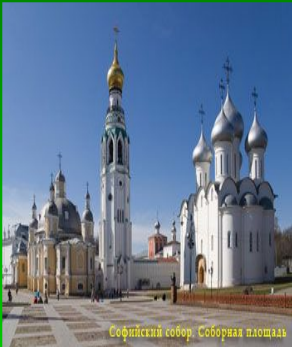
Софийский собор. Соборная площадь