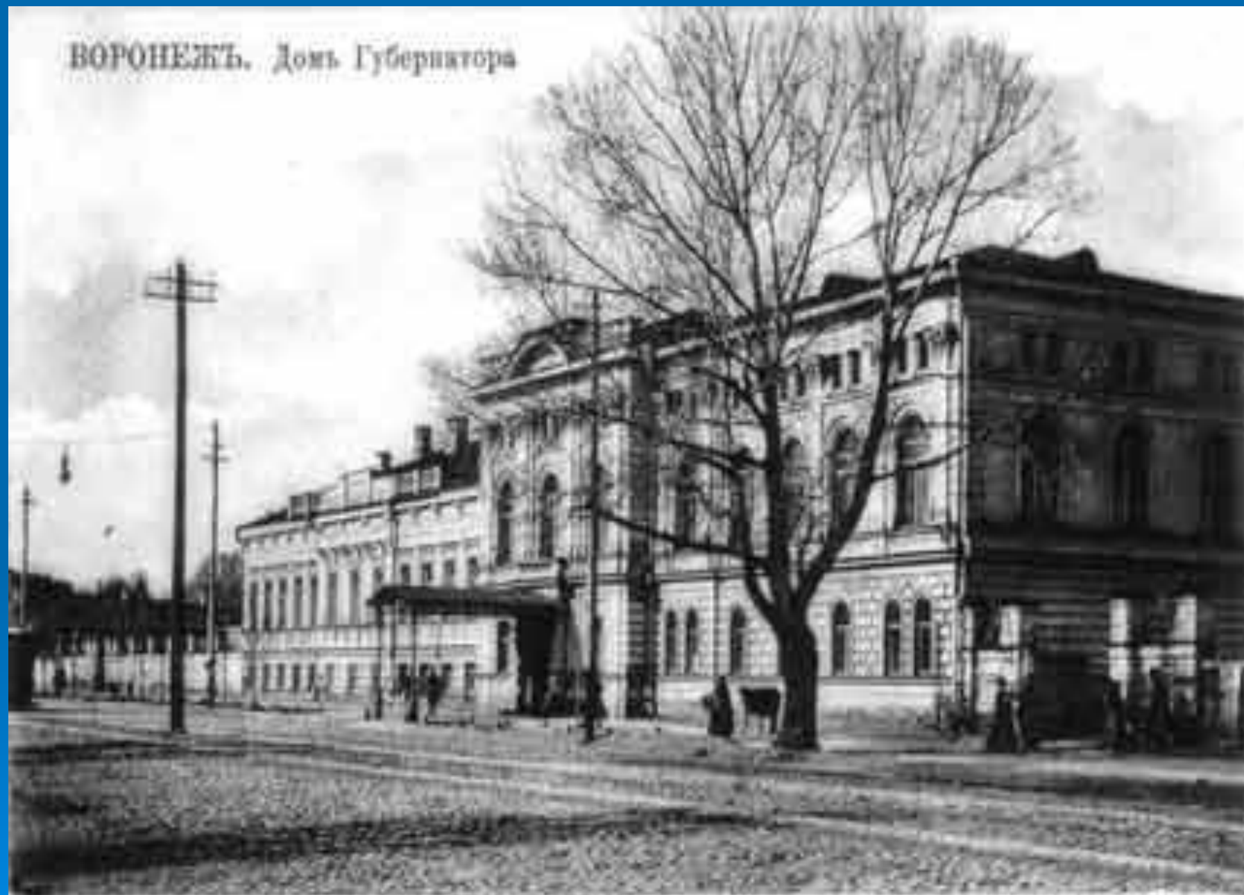
ВОРОНЕЖЪ. Домъ Губернатора