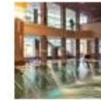
Spa Complex Premium Luciano