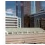
Hotel Korston Royal Kazan