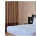
Center Hotel Kazan Kremlin