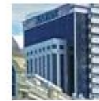
Grand Hotel Kazan