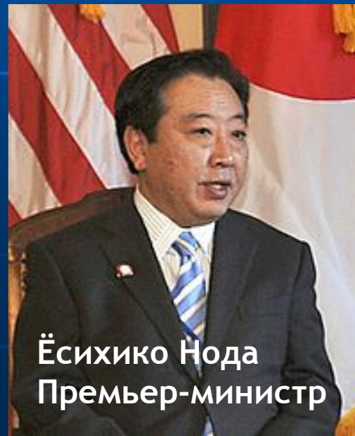
Ёсихико Нода Премьер-министр