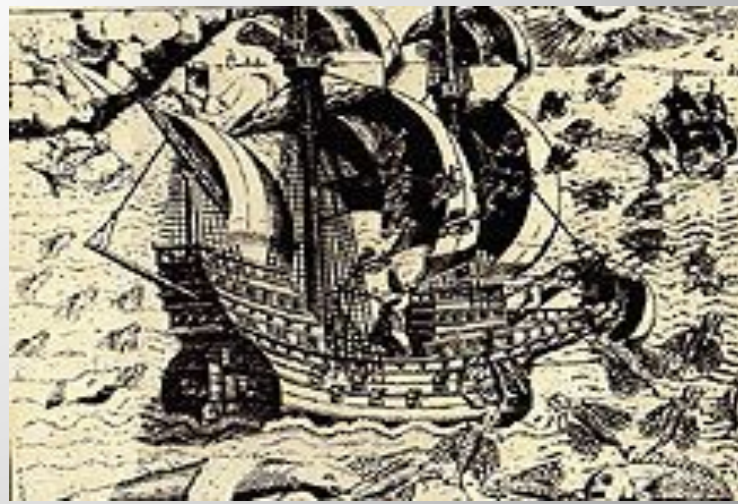
Каравеллы Христофора Колумба

В 1476—84 жил в Лиссабоне и на португальских островах Мадейра и Порту-Санту. Опираясь на античное учение о шарообразности Земли и на неверные расчёты учёных 15 в., Колумб составил проект западного, по его мнению кратчайшего, морского пути из Европы в Индию.