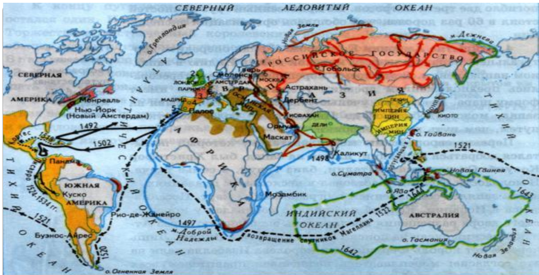
Маршруты важнейших путешествий в XV-середине XVII в.