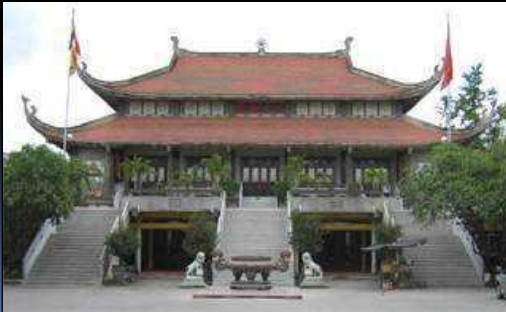
Діюча буддійська пагода в м. Хошіміне