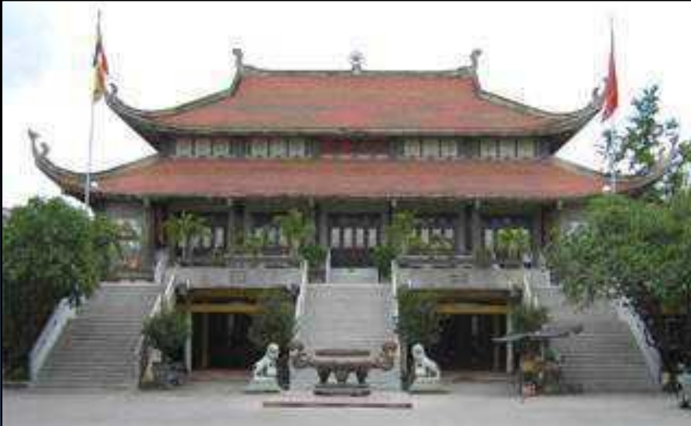
Діюча буддійська пагода в м. Хошіміне