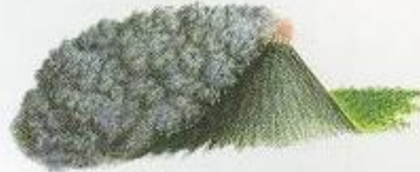
Пелейский (от Монтань-Пеле на Мартинике). Вслед за густой лавой вниз ползет «палящая туча» из газов и пепла.