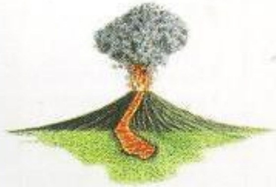
Гавайский. Жидкая лава образует низкий и широкий (щитовой) вулкан.