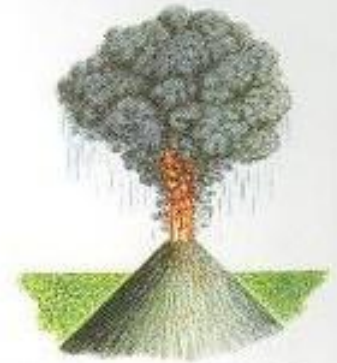
Стромболианский (от Стромболи). Взрывы высоко выбрасывают светлое облако с мелкими «бомбами» и шлаком.