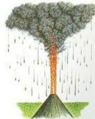
Плинианский (описал для Везувия Плиний Младший). Пыль, пепел и газы образуют над кратером грибовидную тучу огромной высоты.