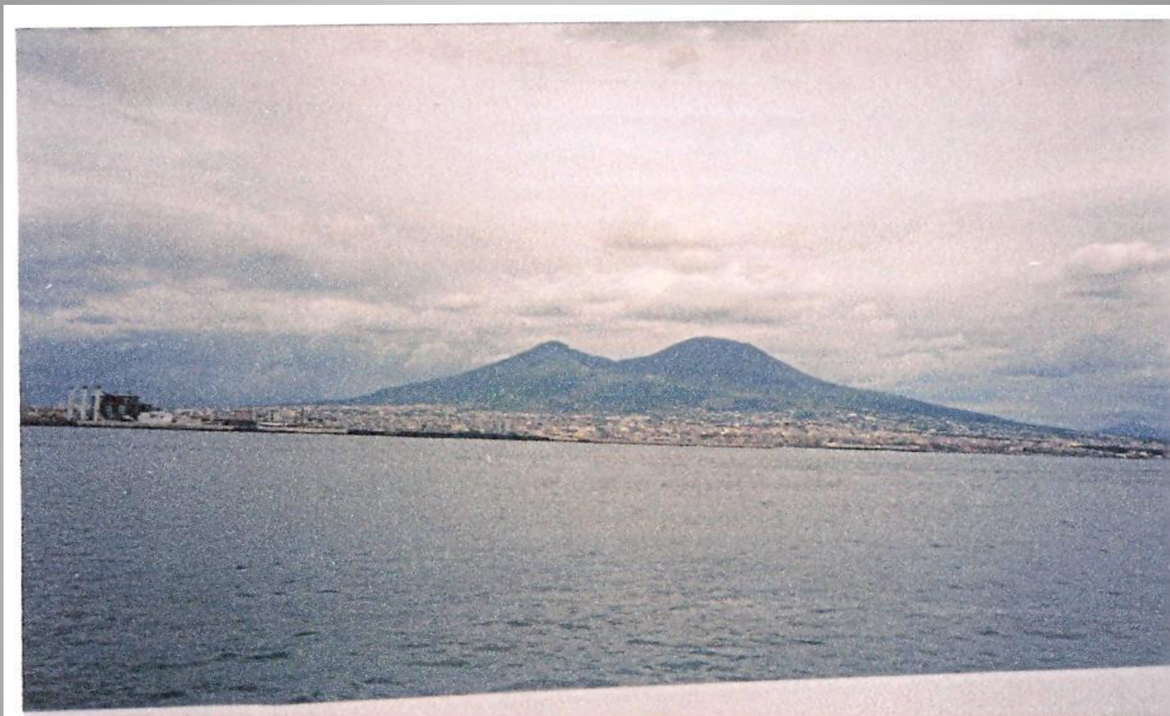
Вид на Везувий