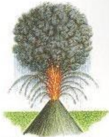
Вулканский (от Вулькано). Взрывы высоко выбрасывают черное облако пыли и пепла с крупными «бомбами».