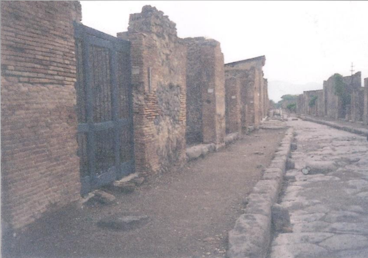
Дорога на центральной улице античного города Помпеи