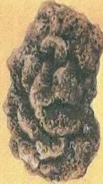
Бомба в виде цветной капусты