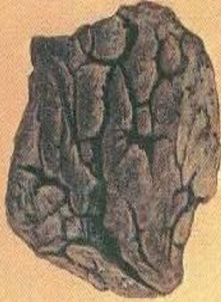
Бомба в виде хлебной корки