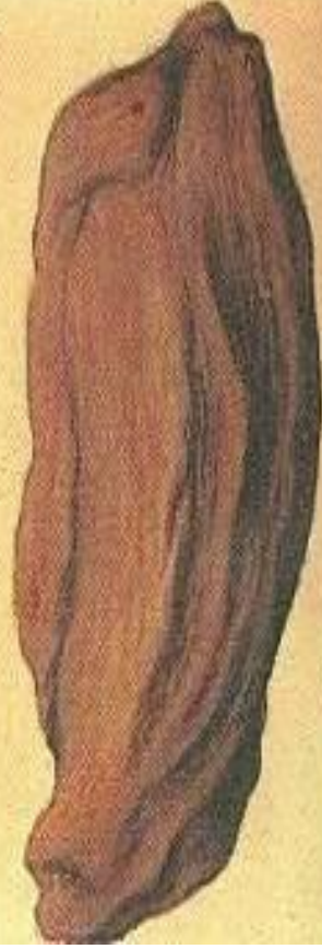
Бомба в виде коровой лепешки