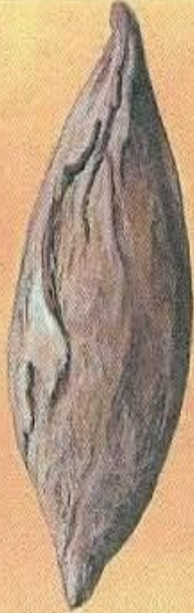
Бомба в форме веретена