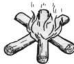
Рис. 38. Костер типа звездный.