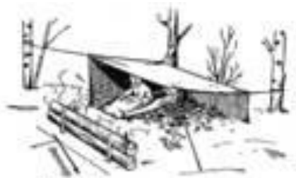
Рис. 39. Костер на двух бревнах.