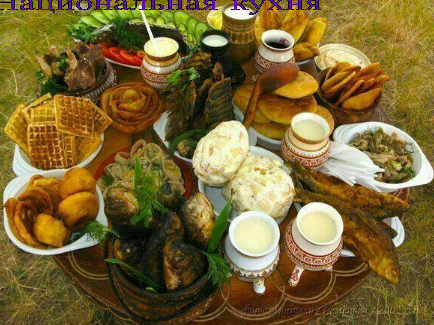
2009 год