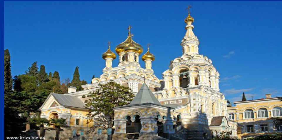
Собор Александру Невскому