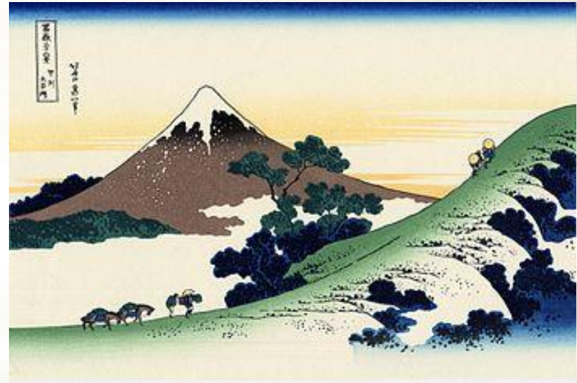
Кацусика Хокусай 36 видов Фудзи , 1830 г.