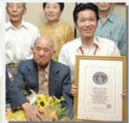
Вручение сертификата старейшего жителя планеты японцу Томодзи Танабэ