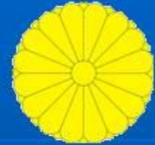
Государственный герб Японии