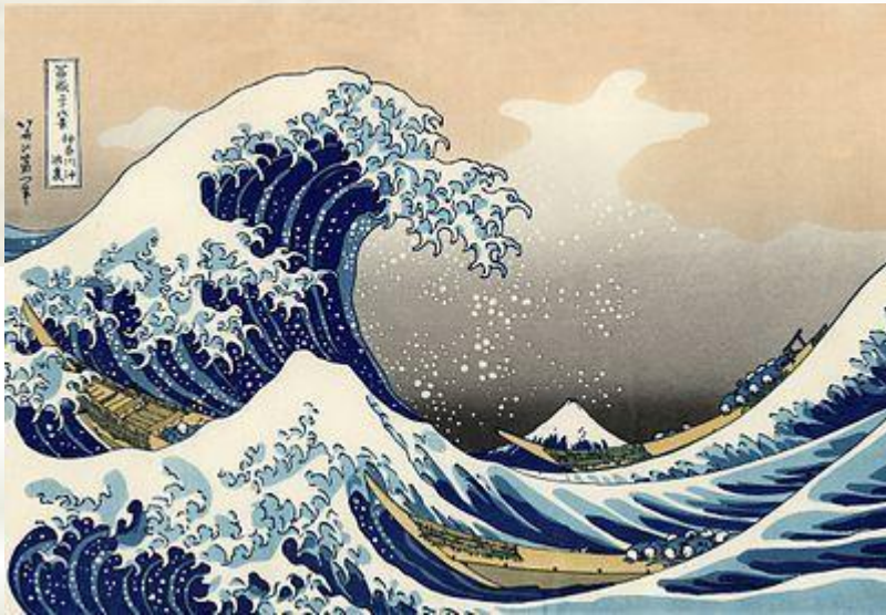
Кацусика Хокусай Большая волна в Канагаве, 1823—1831

Для японской живописи, характерно отведение ведущего места природе и изображение её в качестве носительницы божественного начала.