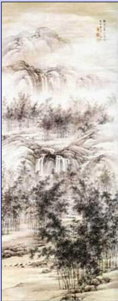
• Ямамото Байицу. «Бамбуковая роща» эпоха Эдо (19 век). Кагэмоно.