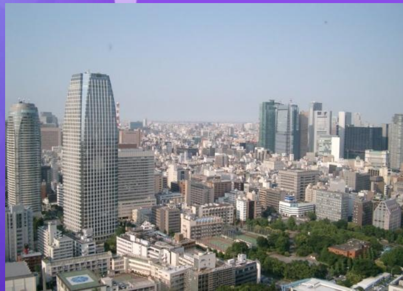
Вид на город с телевизионной башни Токио