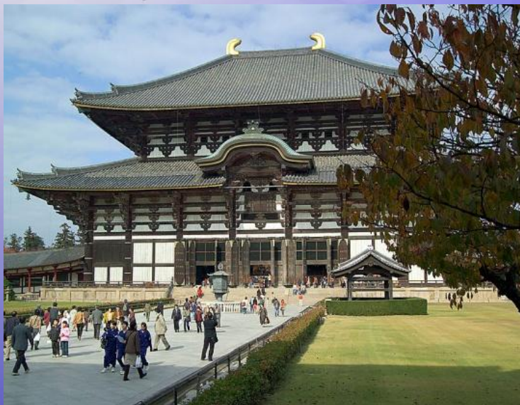
Тодай- дзи, Нара (Всемирное наследие)