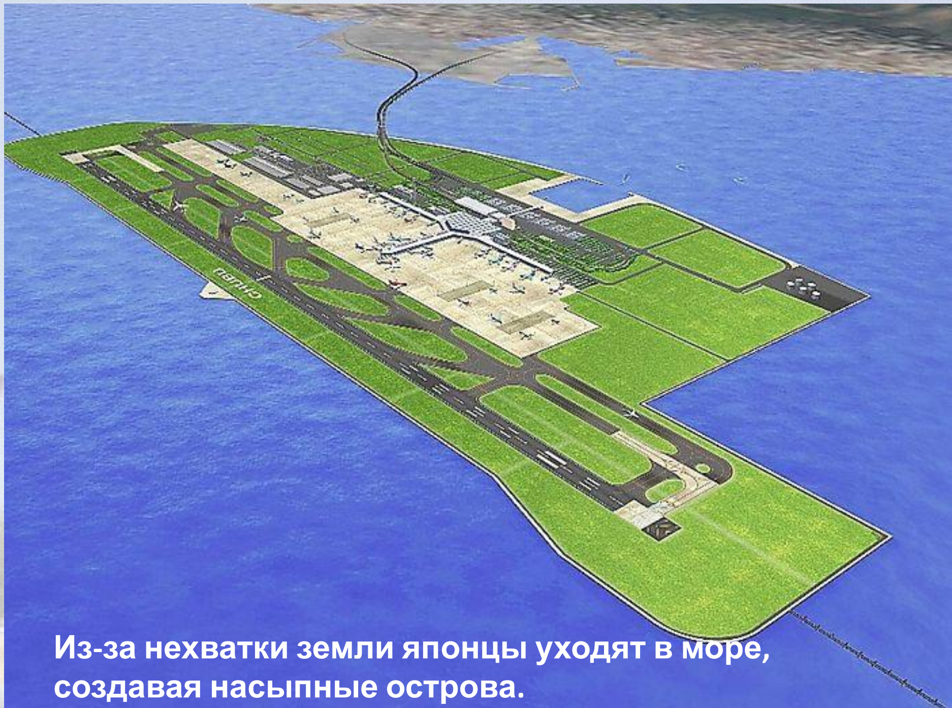
Из-за нехватки земли японцы уходят в море, создавая насыпные острова.