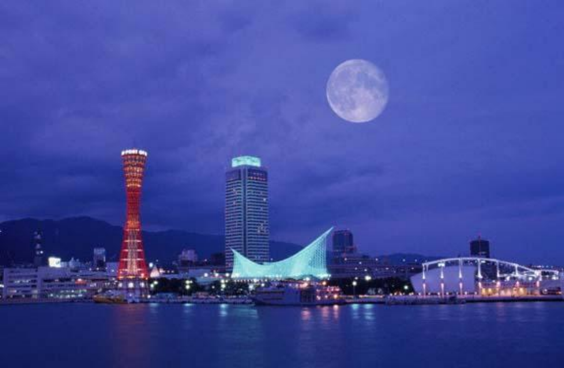
Япония. Город Кобе