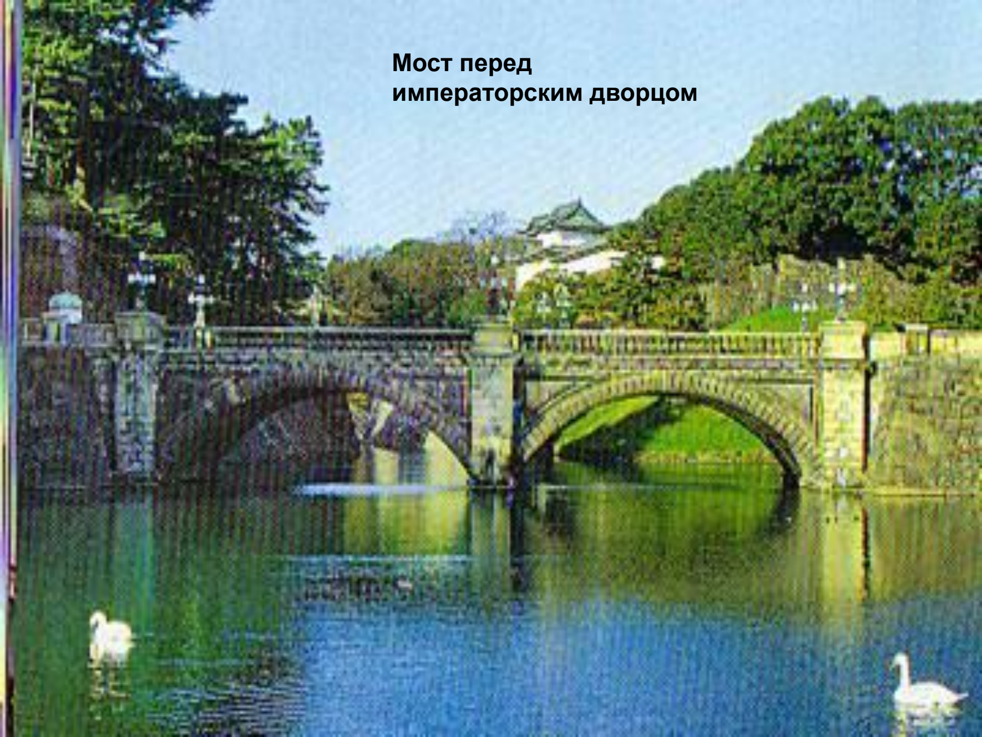
Мост перед императорским дворцом