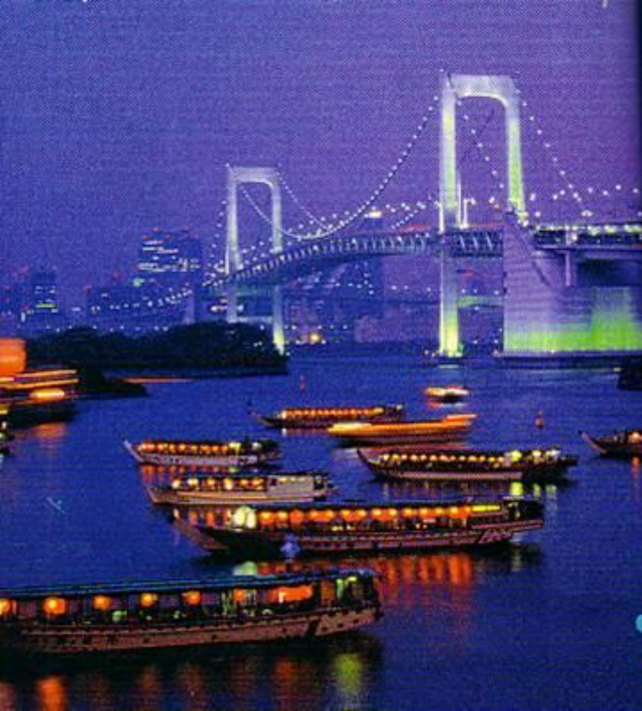
Радужный мост над Токийским заливом