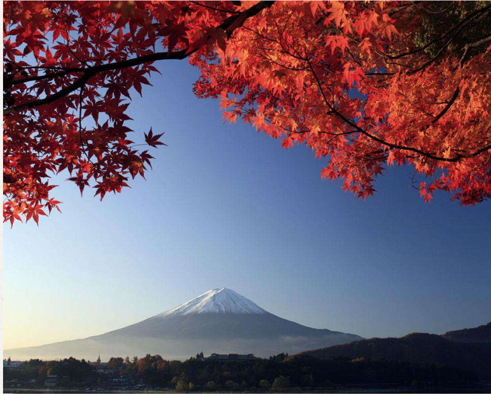
Фудзияма - высшая точка Японии.