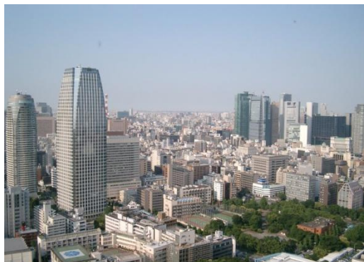
Вид на город с телевизионной башни Токио