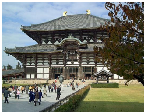
Тодай- дзи, Нара (Всемирно е наследие)