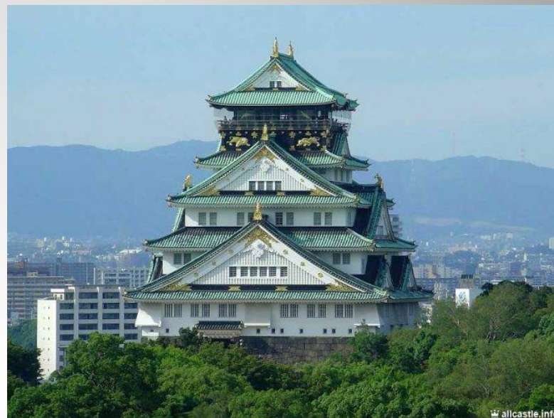
Замок в Осаке