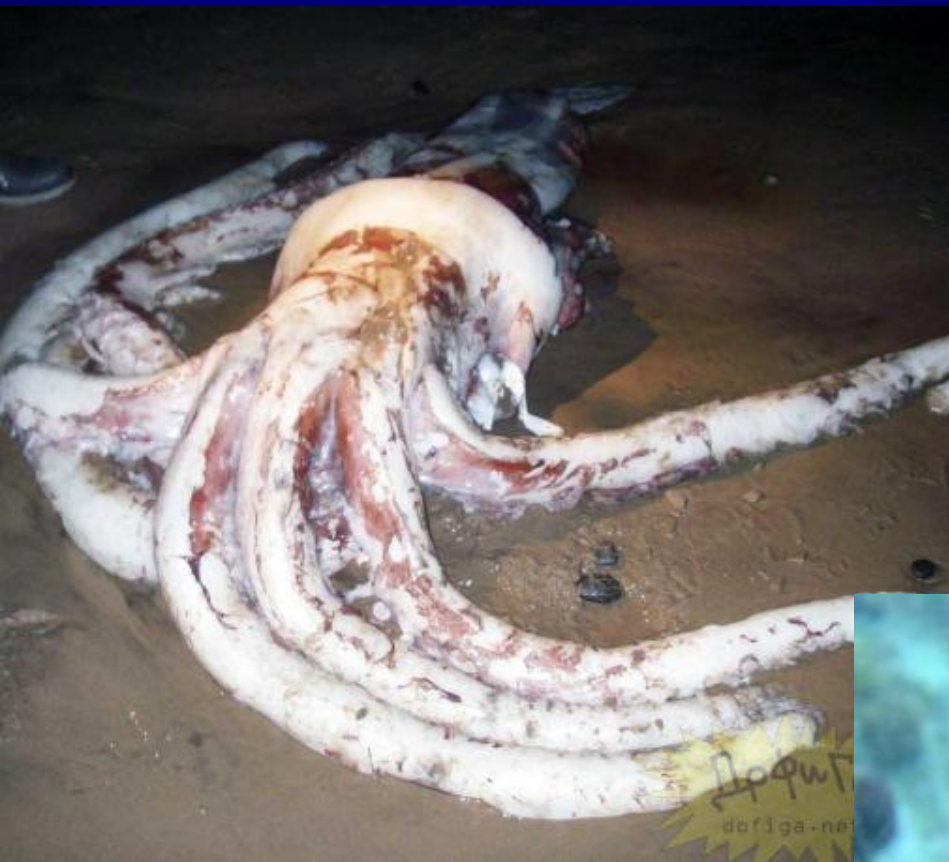
Гигантский кальмар на берегу Тасмании, пойманный в 2007 году. Его размер – 1 метр в диаметре в самом широком и 8 метров в длину