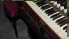
МУЗЕЙ МУЗЫКА И ВРЕМЯ