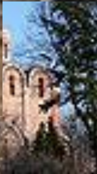
МУЗЕЙ МУЗЫКА И ВРЕМЯ