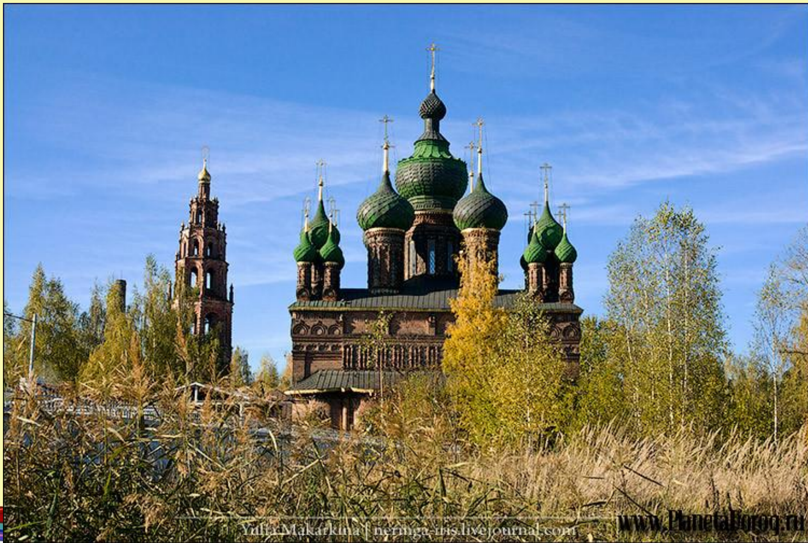
Церковь Иоанна Предтечи в Толчкове