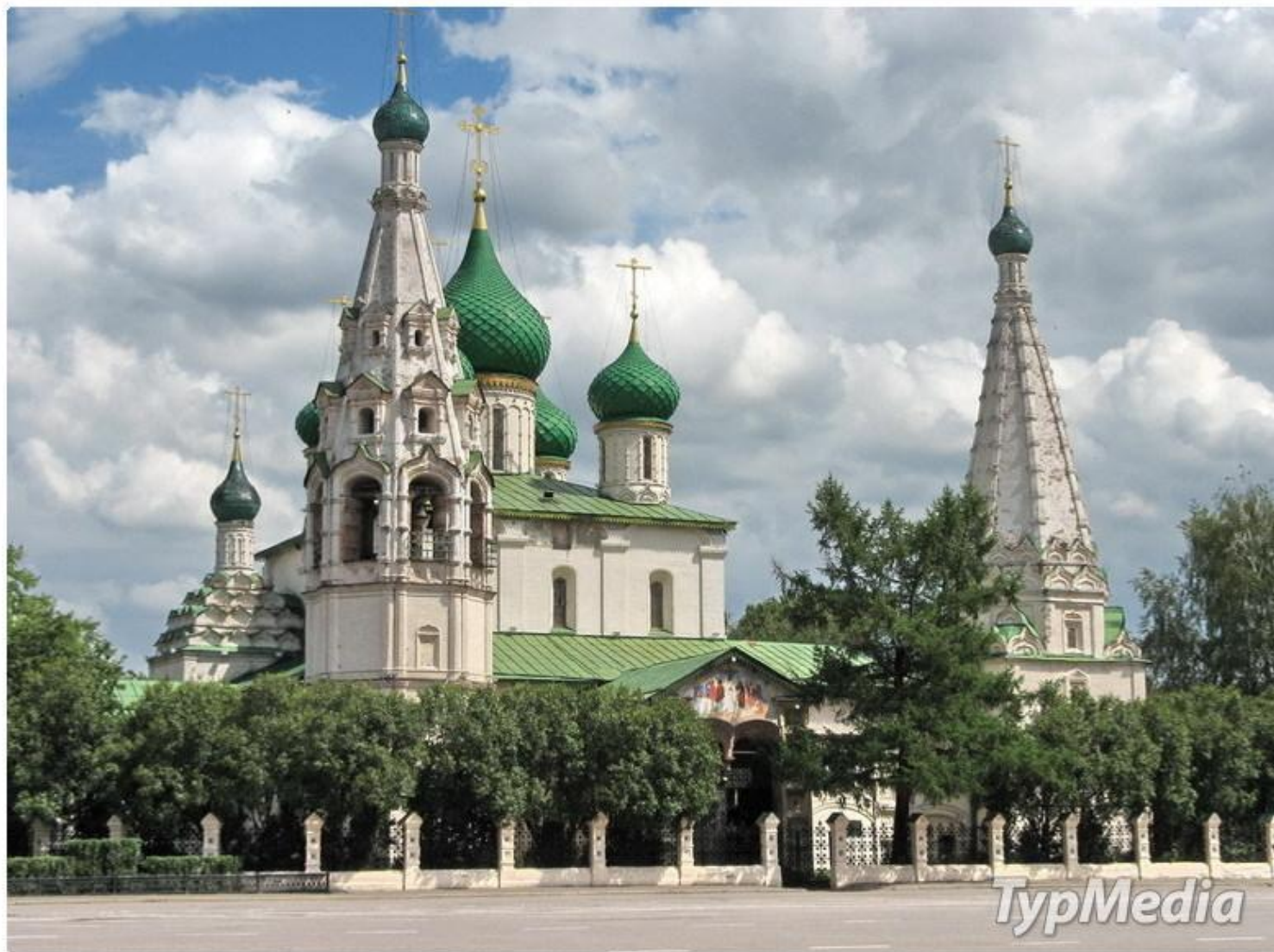
Церковь Ильи Пророка