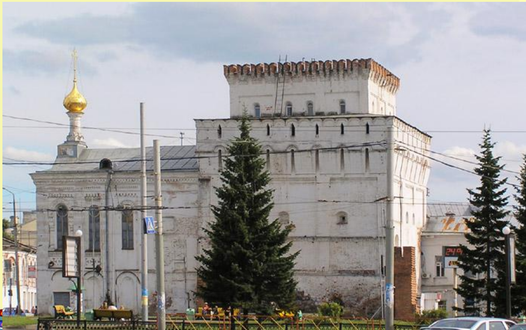
Знаменская башня и церковь