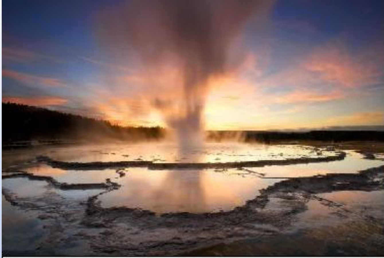
Гейзер Великий Фонтан (The Great Fountain Geyser). Извергается каждые 9-15 часов на высоту от 22 до 67 м