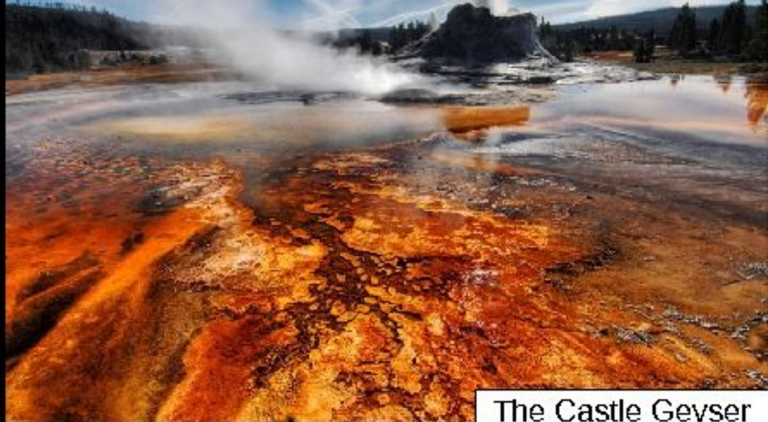
The Castle Geyser