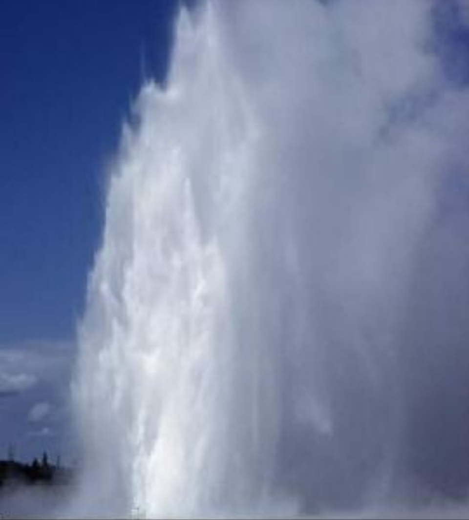
Гейзер Сплендид (Splendid Geyser)