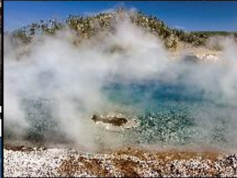
Гейзер Эксэльсиэ (Excelsior Geyser). На самом деле гейзер является горячим источником, а его извержение зафиксировано лишь один раз в 1888 г.