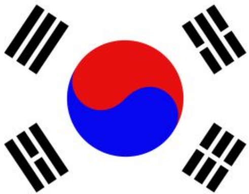
Флаг Республики Корея