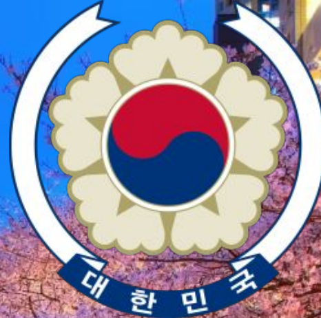
Герб республики Корея

Девиз : « 널리 인간 세계를 이롭게 하라 (Приносить пользу человечеству, 弘益人間) »