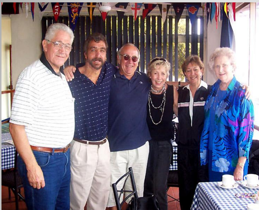
БУРЫ – потомки голландских переселенцев