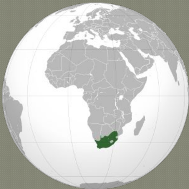
ЮАР на карте мира