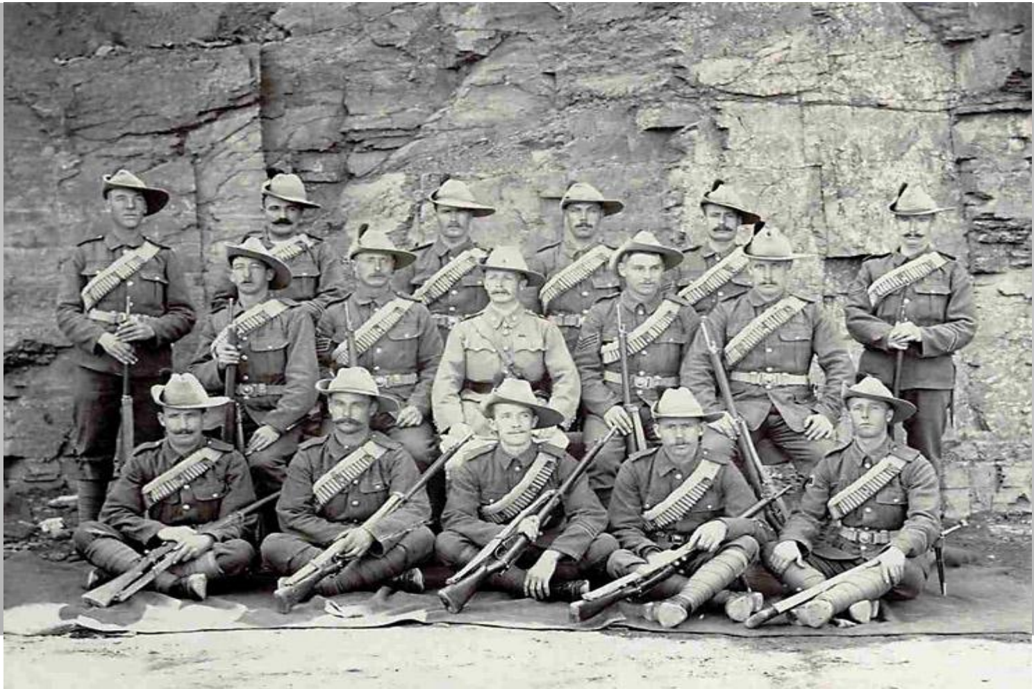
Бурские солдаты – 1902 год