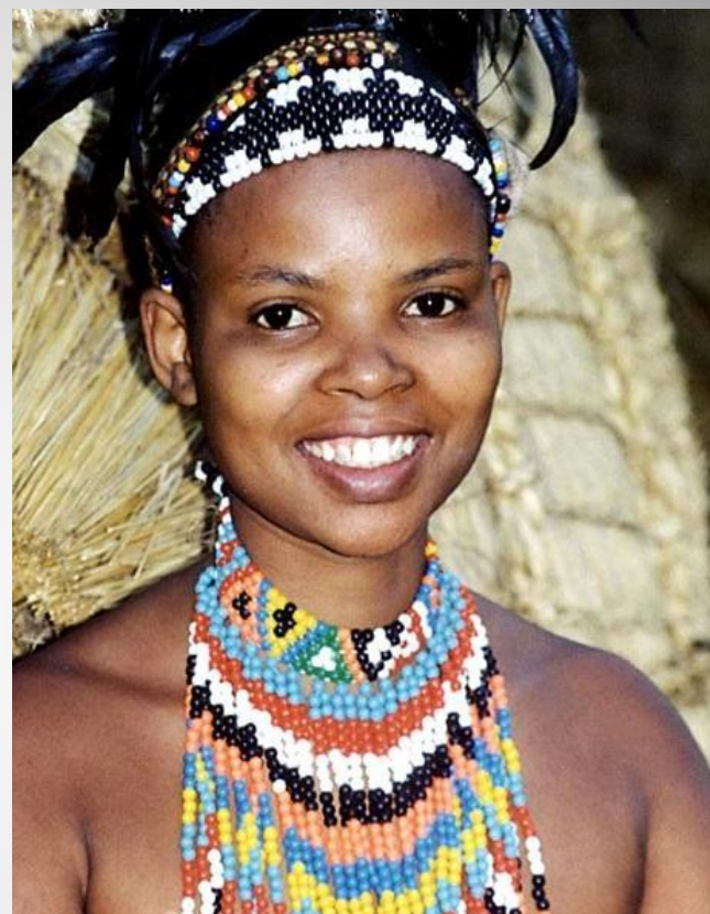
Девочка из племени Зулусу