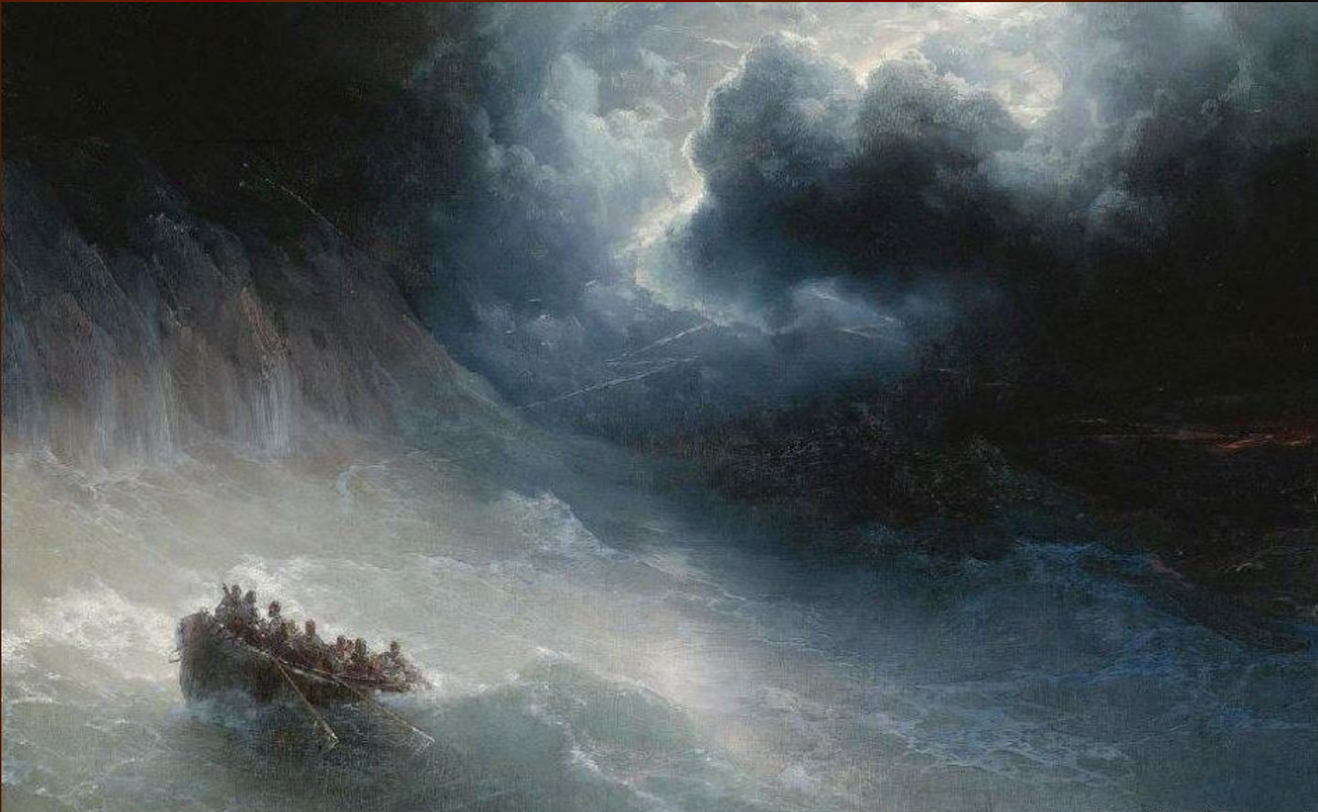
И. Айвазовский. Девятый вал