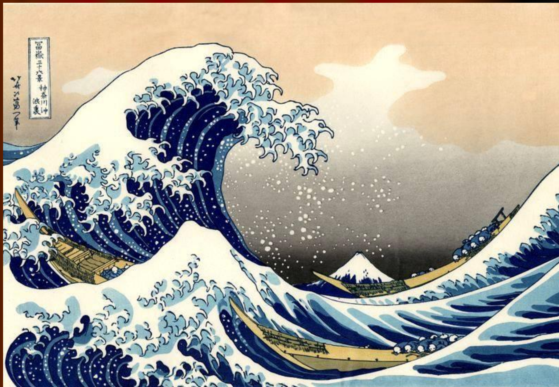
Кацусика Хокусай. Большая волна в Канагава